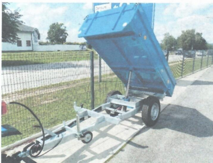
Dostatočný výklopný uhol, trojstranne sklápateľný