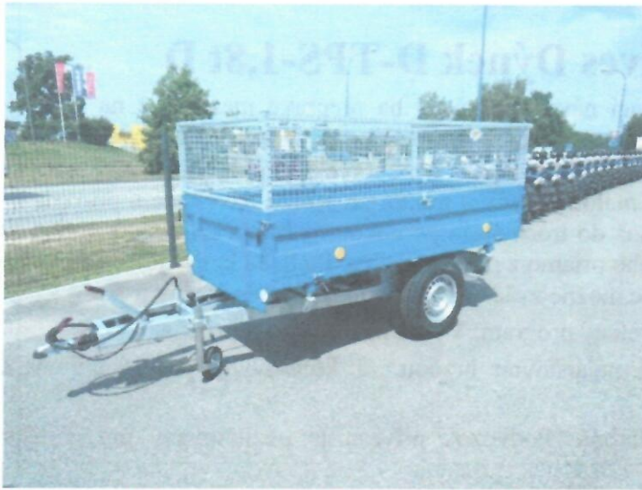
Náves so sieťkovou nadstavbou za príplatok.